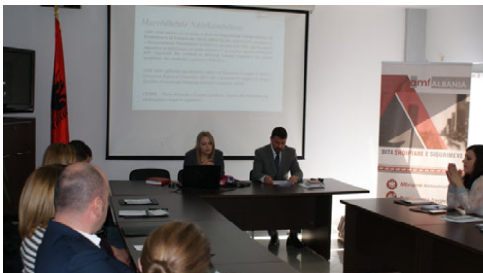
Drejtes të lartë të AMF-së gjatë takimit informues me median

Autoriteti i Mbikëqyrjes Financiare organizoi në datën 15 shkurt 2017 një takim informues me gazetarë të mediave të shkruara dhe vizive që pasqyrojnë lajmet ekonomike.