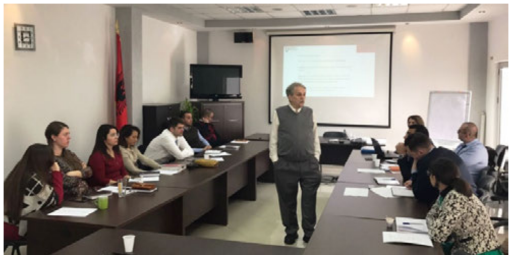
Gjatë trajnimit mbi parimet e praktikat dhe bazat e mbikëqyrjes në sigurime

Gjatë trajnimit u diskutua lidhur me parimet, praktikat dhe politikat në sigurime. Tematikat e trajtuara lidheshin si me koncepte teorike ashtu edhe me praktikat specifike të punës gjatë mbikëqyrjes në sigurime.